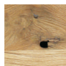
Nagel- oder Bolzenlöcher