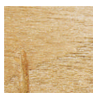
Unebenheiten durch Verarbeitung